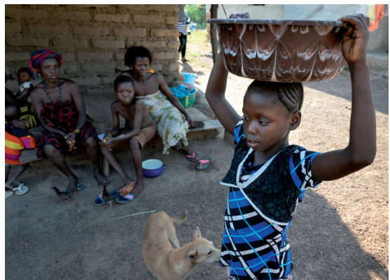
Nach der Halbtagschule muss dieses Mädchen in Sierra Leone als Straßenverkäuferin arbeiten.